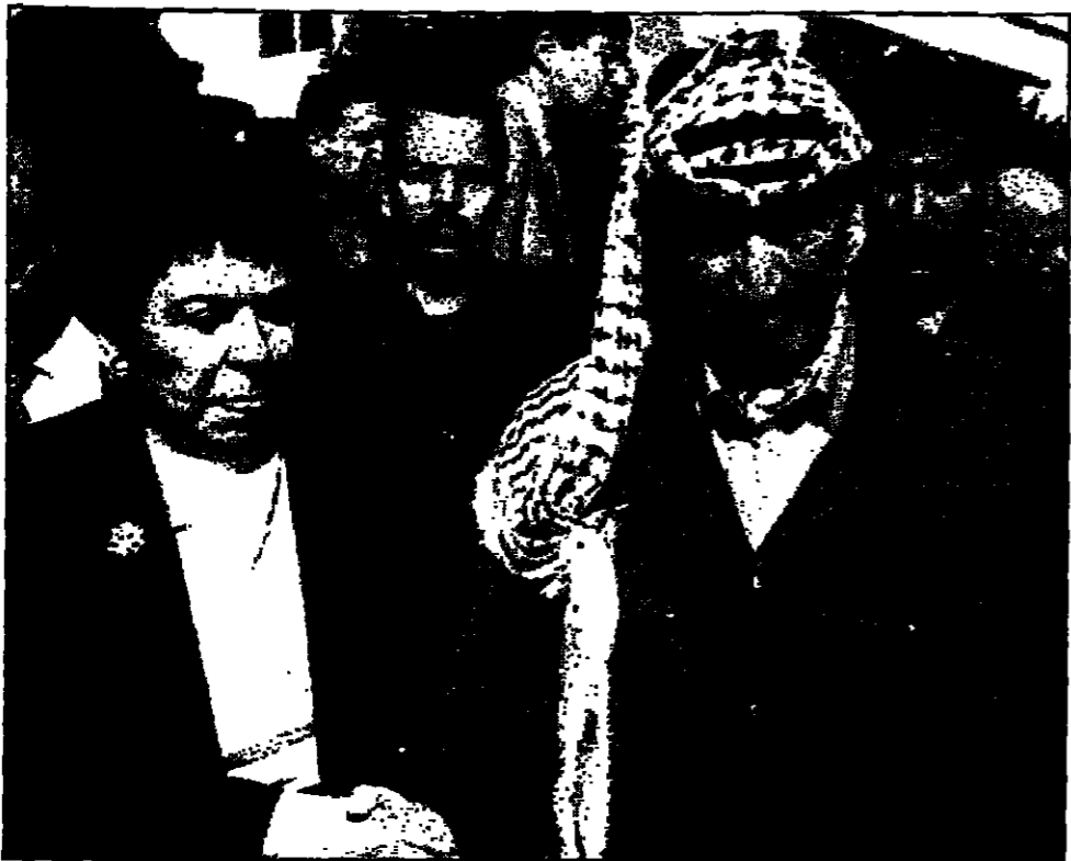
الرئيس الفلسطيني لدى استقباله وزيرة الصحة الأمريكية في غزة أمس (رويترز)

تنتياهو وعرفات يتبادلان الاتهامات بشأن تنفيذ اتفاق واي.. وروس يصل المنطقة الاسبوع المقبل